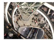
My Zeil, la nuova dimensione dello shopping a Francoforte