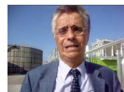
Eridania Sadam investe nell'accoppiata zucchero-energia

Il Consiglio di Amministrazione di Luxottica ha approvato il progetto di scissione parziale della controllata Luxottica Srl, a favore della controllante. In base al progetto, i principali elementi del patrimonio (contratti di licenza, aziende di moda e attività di distribuzione) verranno assegnati alla