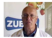
L'agricoltura secondo Zuegg